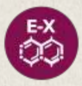
DIÓXIDO DE AZUFRE Y SULFITOS