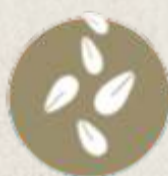
GRANOS DE SÉSAMO