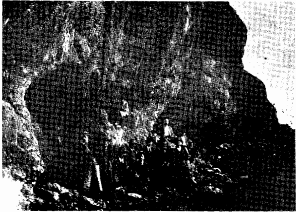
Cuevas del Santuario ibérico

doce metros una extensión circular que cuenta diez de diámetro, toda abierta en la boca y con un orificio en el centro del techo que comunica con el exterior, dando paso al aire y la luz. Como por el transcurso del tiempo han ido depositándose en aquella caverna grandes cantidades de tierra y piedra, no se distingue más que la parte alta de galerías que de la