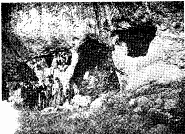
Caverna al lado del Santuario, de frente

Desde los muros ciclópicos atribuidos á los Pelasgos hasta nuestros días, ¡qué diversidad en la habitación del hombre y qué inmensa variedad en sus templos!